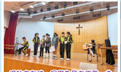
探訪安老院，同學為長者高歌一曲