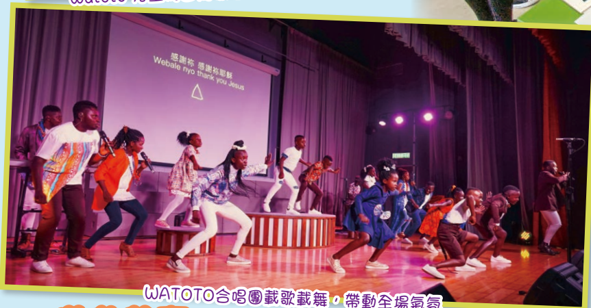
WATOTO合唱團載歌載舞，帶動全場氣氛