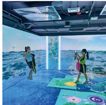
參觀展城館，用電子地圖認識香港