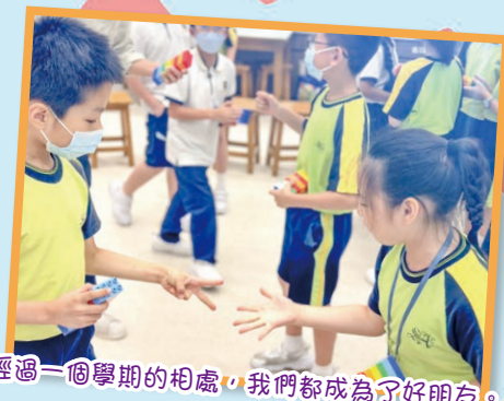
經過一個學期的相處，我們都成為了好朋友。