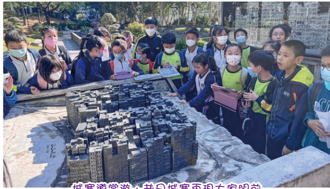
城寨導賞遊，昔日城寨再現大家眼前