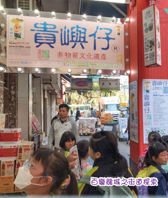
百變龍城之街道探索

於 2022-2024 推行我的行動承諾加強版活動（優質教育基金計劃），本年度(2023-2024)在四年級的課題——（香港社會的變遷），與外間機構合作，推行與國民教育和國家安全教育相關的學習活動，讓學生能邊玩邊學，學得快樂，並加強學生的國民身份認同。