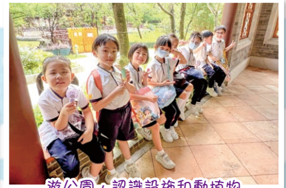
遊公園，認識設施和動植物