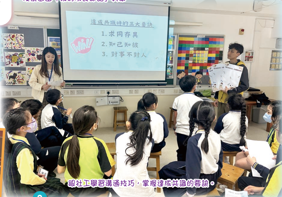
跟社工學習溝通技巧，掌握達成共識的要訣。