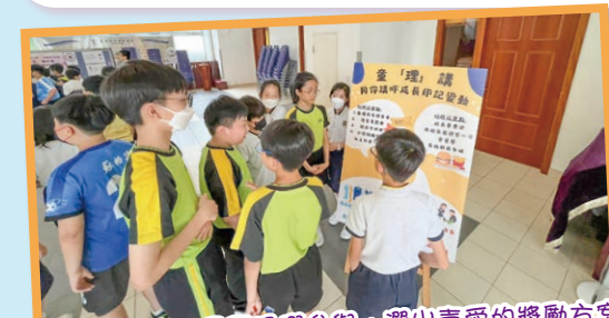
5月9日投票日，同學踴躍參與，選出喜愛的獎勵方案。