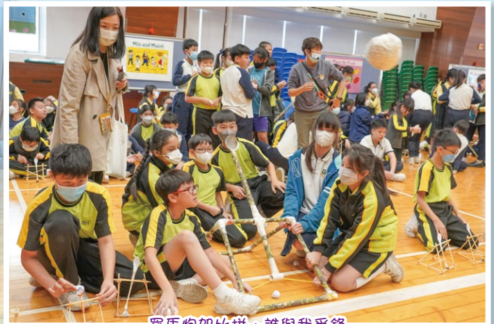
羅馬炮架比拼，誰與我爭鋒