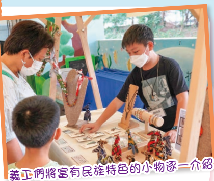
義工們將富有民族特色的小物逐一介紹

音樂會現場更設富有烏干達民族特色的手工藝品販售攤檔及助養計劃招募，得到場人士踴躍支持，令音樂會生色不少。