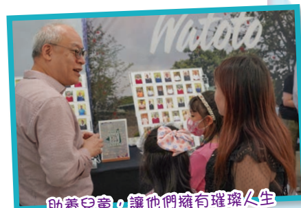
助養兒童，讓他們擁有璀璨人生

為鼓勵學生實踐校訓：「非以役人、乃役於人」。本校更參與WATOTO的「助養計劃」，全校學生共合力助養36名烏干達孤兒；透過分享行善，將仁愛實踐。學生亦透過不同渠道，與受助的兒童互相溝通。過程讓我們的學生知感恩，懂珍惜；欣賞生命的獨特性，見證天父的救恩與大能。