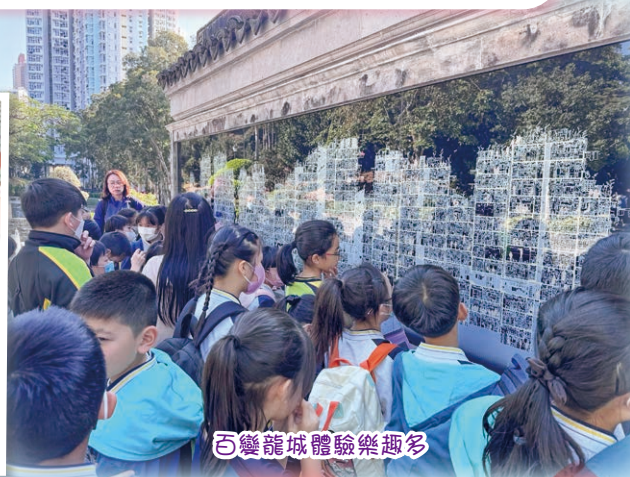
百變龍城體驗樂趣多