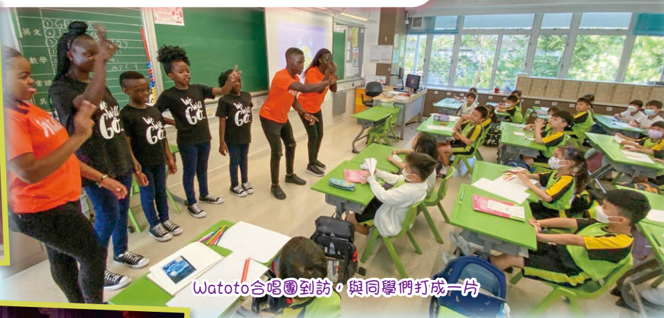
Watoto合唱團到訪，與同學們打成一片