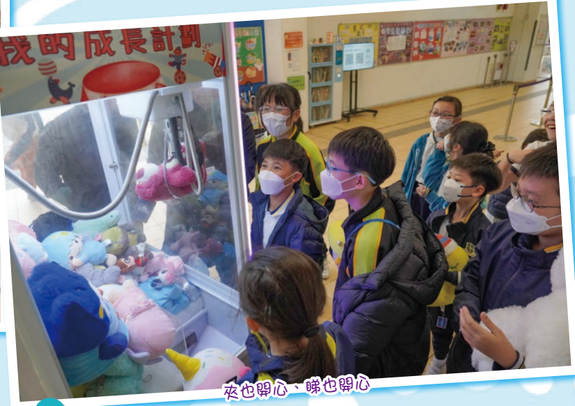
夾也開心、睇也開心