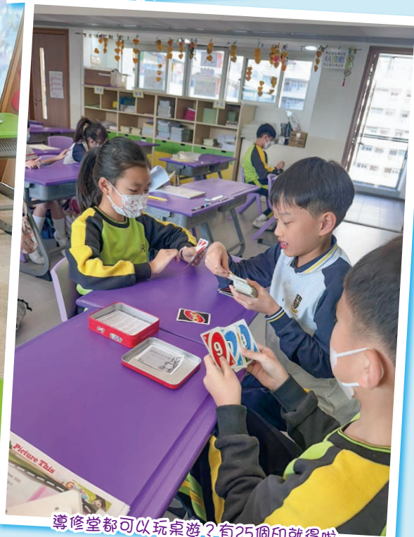
導修堂都可以玩桌遊？有25個印就得啦