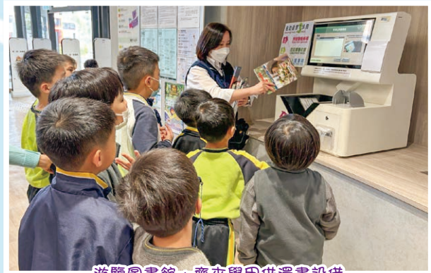
遊覽圖書館，齊來學用借還書設備