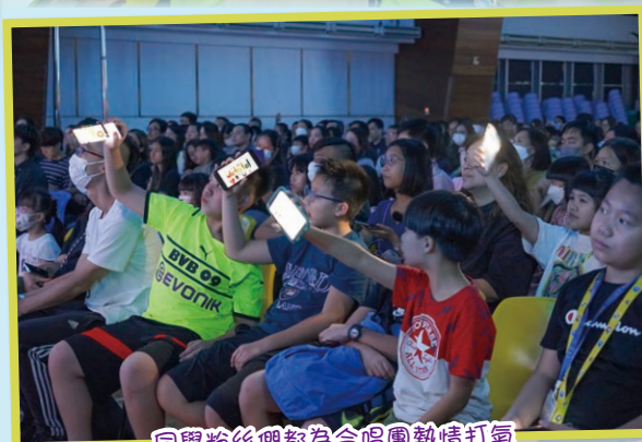
同學粉絲們都為合唱團熱情打氣