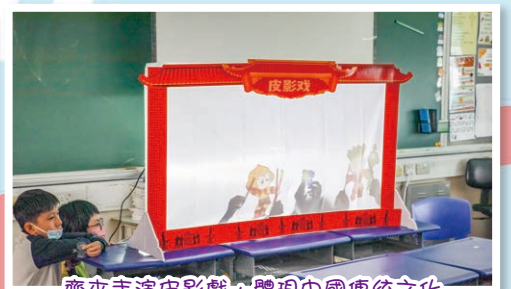
齊來表演皮影戲，體現中國傳統文化