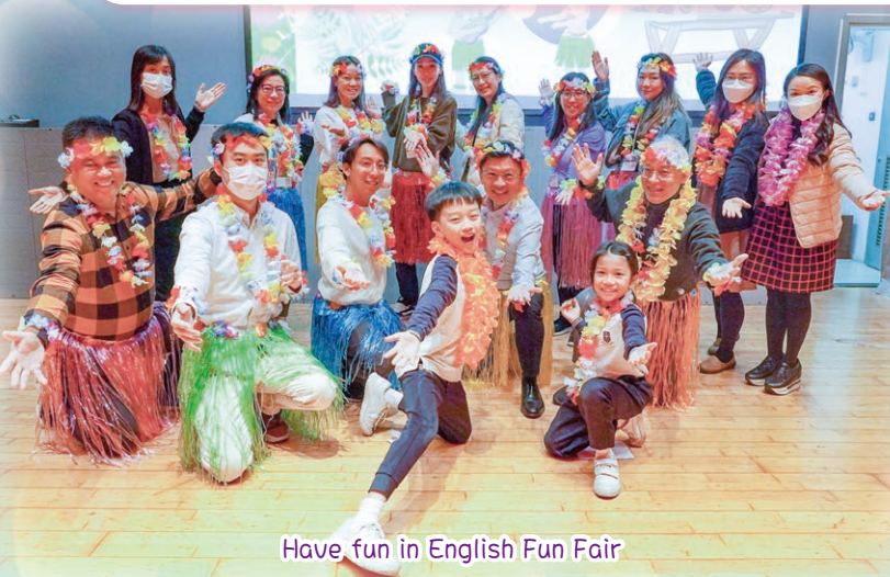
Have fun in English Fun Fair