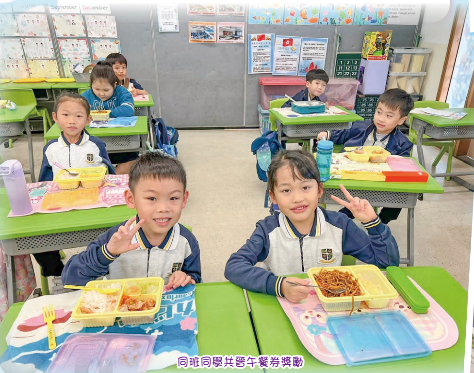
同班同學共晉午餐券獎勵