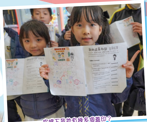
你睇下我地有幾多個蓋印？

透過印記內的「我的成長存摺」，學生一方面能夠記錄自己為成長付出的點滴，另一方面也能以豐碩的學習成果兌換不同獎勵。看着學生得到獎勵時的喜悅，不難感受到他們那份努力的滿足。不過，我們要緊記其實獎勵只是其次，而成長最重要的獎勵——我們的「陪伴」。在此希望學生在活出自己獨有的成長印記時，總有老師和家長陪伴左右，才是他們最珍貴的回報。