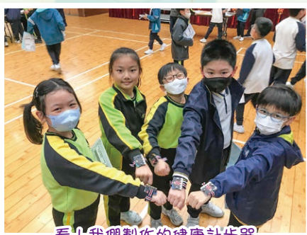
看！我們製作的健康計步器