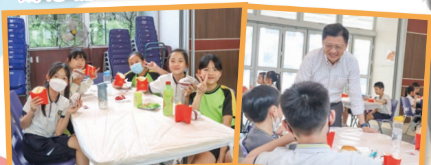
願望成真，感謝校長和老師安排「校長麥麥送」!!